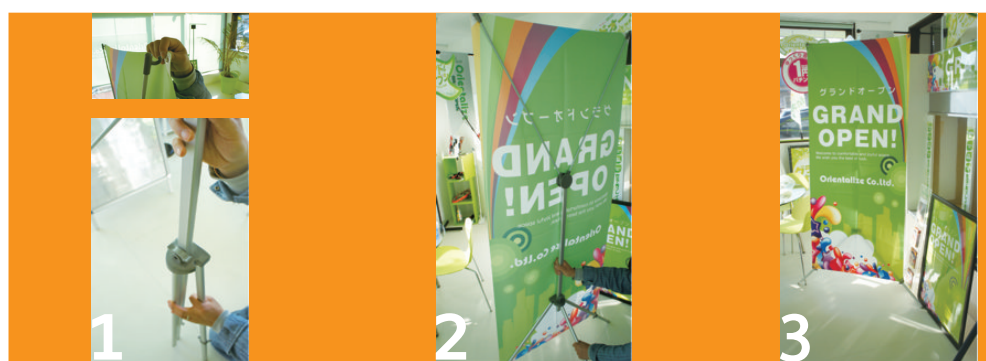
1 ポケットをラックのメッシュ部分にかけます。

● シルバー アルミ / FRP/ABS w450~650mm H1,400~1,700mm