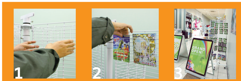
1 ポケットをラックのメッシュ部分にかけます。