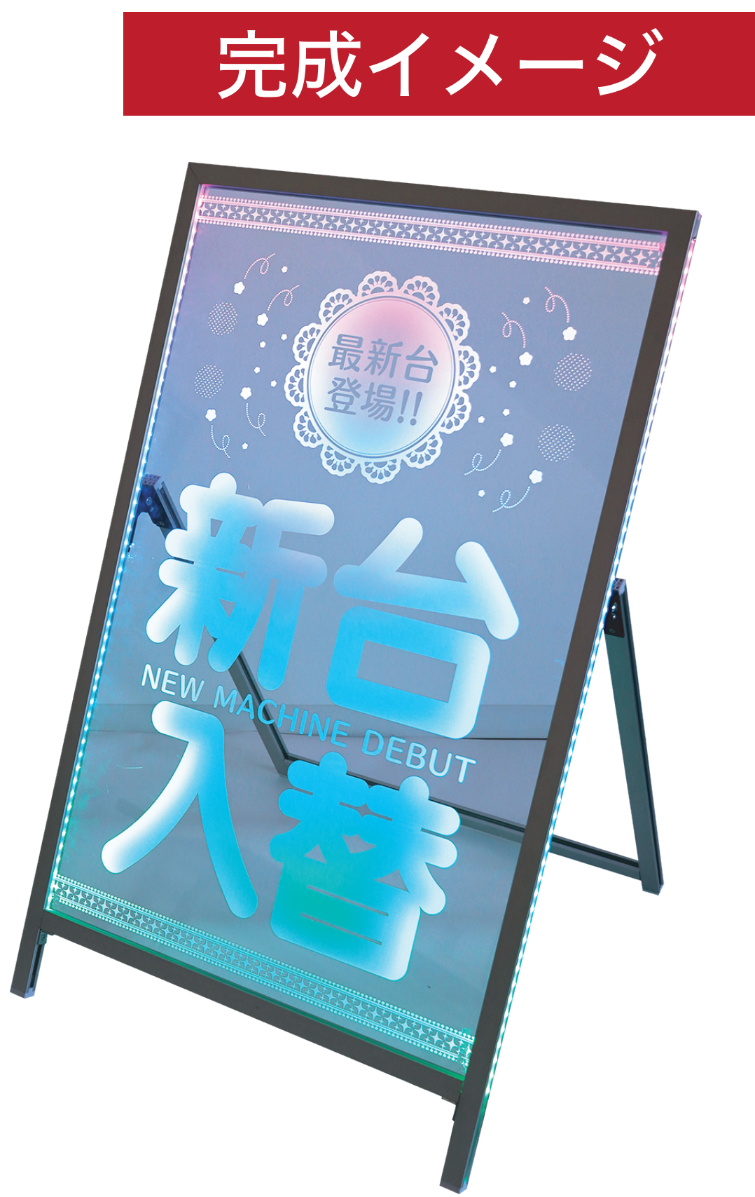
上記画像はA1サイズです。